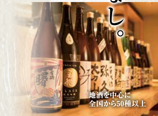
地酒を中心に 全国から50種以上